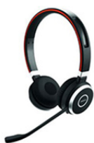
Casque filaire Jabra Evolve 40/ Bluetooth Jabra Evolve 65