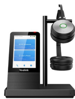
Casque Bluetooth Yealink WH66