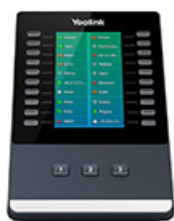
Module d'extension Yealink EXP50