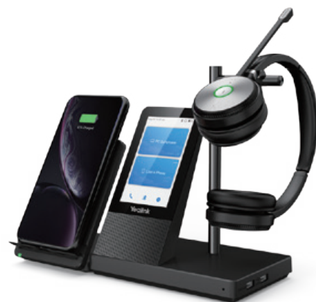
WH66 Mono/Dual: Teams WH66 Mono/Dual: UC

Le Yealink WH66 est le casque sans fil DECT leader du secteur. Avec les modèles WH66 Dual et WH66 Mono, il offre une toute nouvelle forme de collaboration de bureau. Parfaitement compatible avec les plates-formes de communications unifiées, il s'intègre en mode natif avec les téléphones IP Yealink. L'écran tactile capacitif de 4,0 pouces (480 x 800) de la base offre une nouvelle expérience de travail, pour tout contrôler d'une simple pression. Il joue le rôle de poste de travail, gérant les appels téléphoniques, se connectant à plusieurs appareils (téléphone de bureau/téléphone mobile/ordinateur), chargeant les téléphones mobiles sans fil, et jouant même le rôle de haut-parleur. Cerise sur le gâteau, cette station de travail multifonctionnelle fonctionne directement dès que vous la branchez. Les choses deviennent plus simples, avec un plus grand confort pour l'utilisateur.