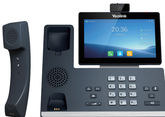
Le T58W Pro avec caméra est doté d'un combiné Bluetooth (sans fil) BTH58